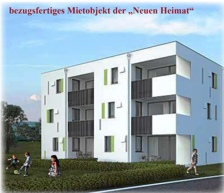
bezugsfertiges Mietobjekt der „Neuen Heimat“