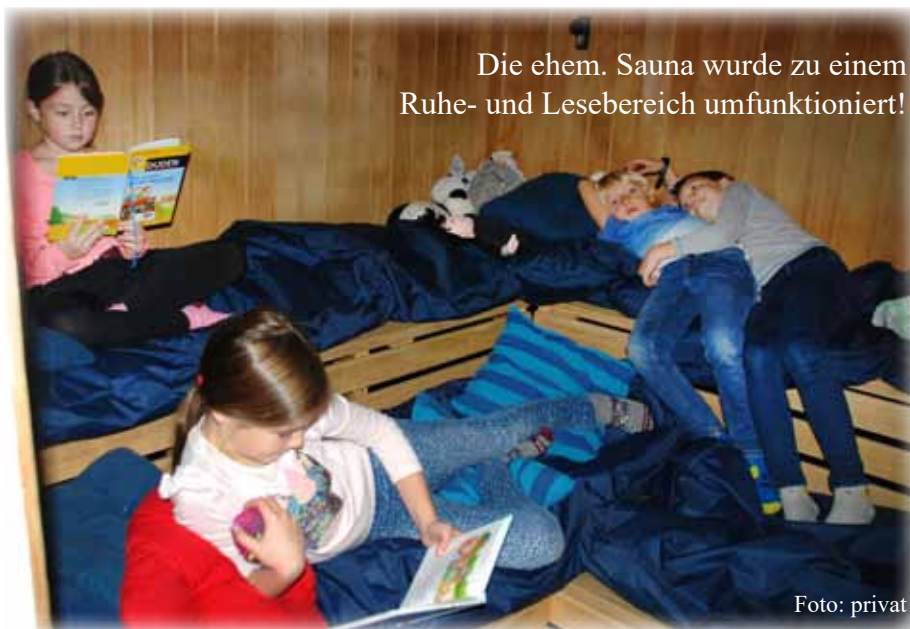
Die ehem. Sauna wurde zu einem Ruhe- und Lesebereich umfunktioniert!

Der neue Spielplatz vor der Volksschule wurde ebenso seiner Bestimmung übergeben. Ich wünsche den Kindern viel Bewegung und Spaß in der Natur. Die ehemalige Sauna in