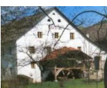
Die Mitarbeiter des Mühlenmuseums

Ein Höhepunkt im 22-jährigen Bestehen des Mühlenmuseums war sicherlich die 600-Jahr-Feier des urkundlichen Bestandes der Ledermühle. Die Mühle ist sicherlich um einiges älter und wir hoffen, dass uns die Bevölkerung noch lange unterstützt.